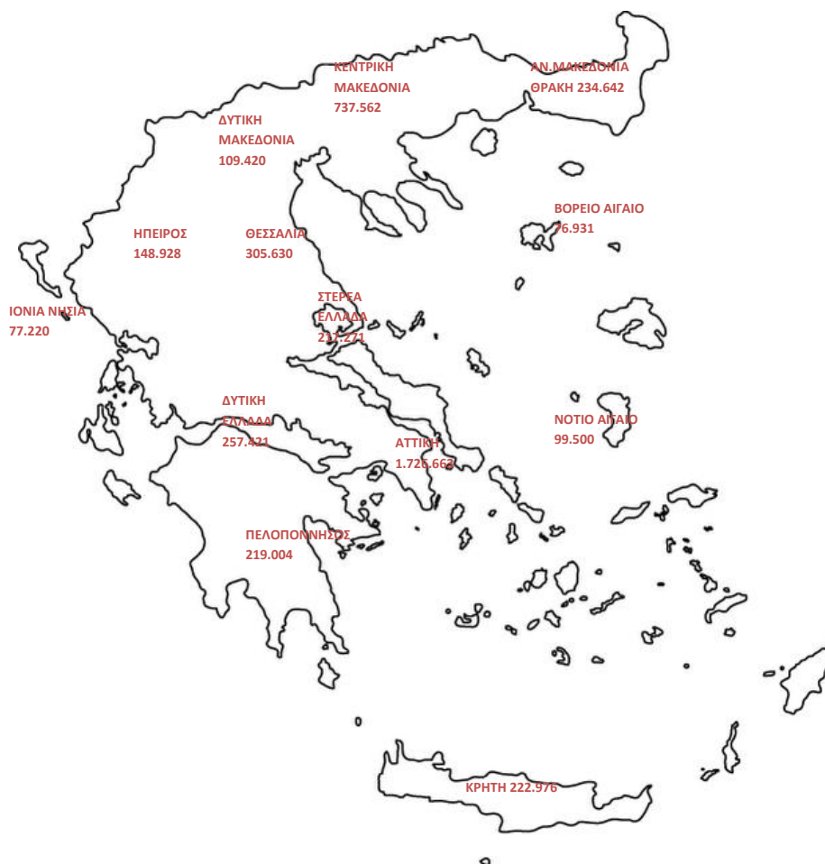
Χάρτης 1: Καταβολή Συντάξεων ανά Περιφέρεια

Για 16.291 εγγραφές δεν υπήρχε ένδειξη ΤΚ και για το λόγο αυτό δεν περιλαμβάνονται στον πίνακα 8. Στο χάρτη που ακολουθεί αποτυπώνεται ο αριθμός των συντάξεων που καταβάλλεται στις 13 περιφέρειες της χώρας.