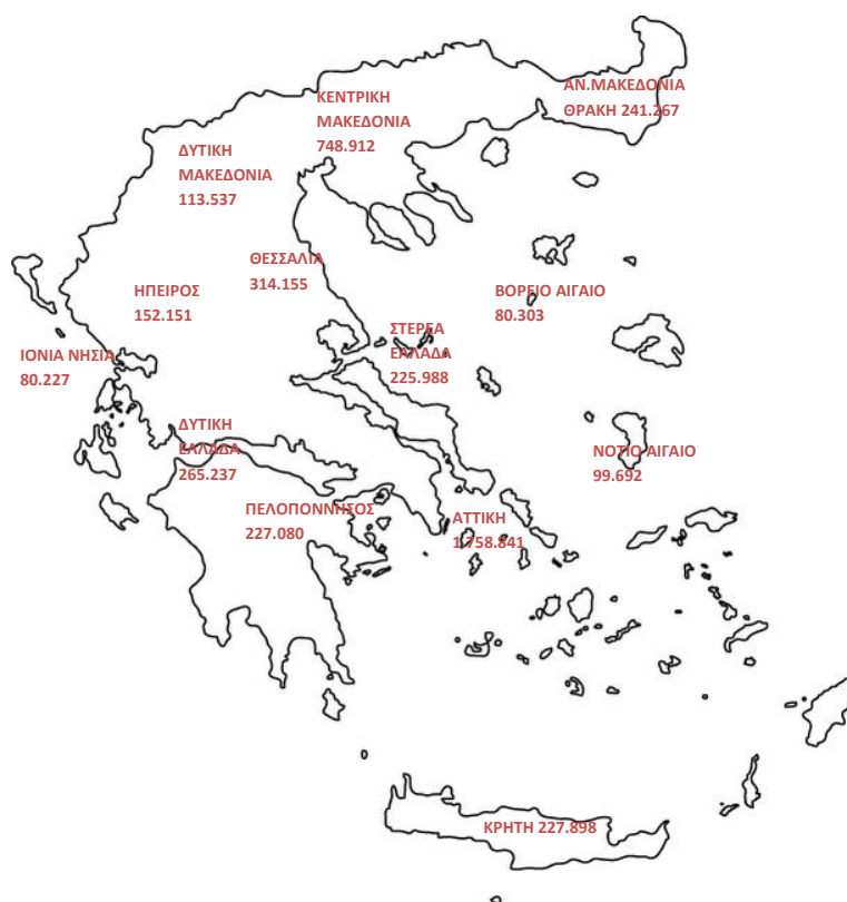
Χάρτης 1: Καταβολή Συντάξεων ανά Περιφέρεια

Στον Πίνακα 17 αποτυπώνονται τα ποσά σύνταξης που αντιστοιχούν σε κάθε Περιφέρεια σε σχέση με το αντίστοιχο ΑΕΠ για το έτος 2013 (προσωρινά στοιχεία ΕΛΣΤΑΤ). Σύμφωνα με τα δεδομένα του Πίνακα 17, στην Περιφέρεια Ηπείρου παρατηρείται η μεγαλύτερη τιμή (22,2%) του λόγου ποσού σύνταξης προς ΑΕΠ και ακολουθεί η Περιφέρεια Θεσσαλίας με τιμή 20,2%. Στην τελευταία θέση βρίσκεται η Περιφέρεια Νοτίου Αιγαίου με τιμή 10,3%.