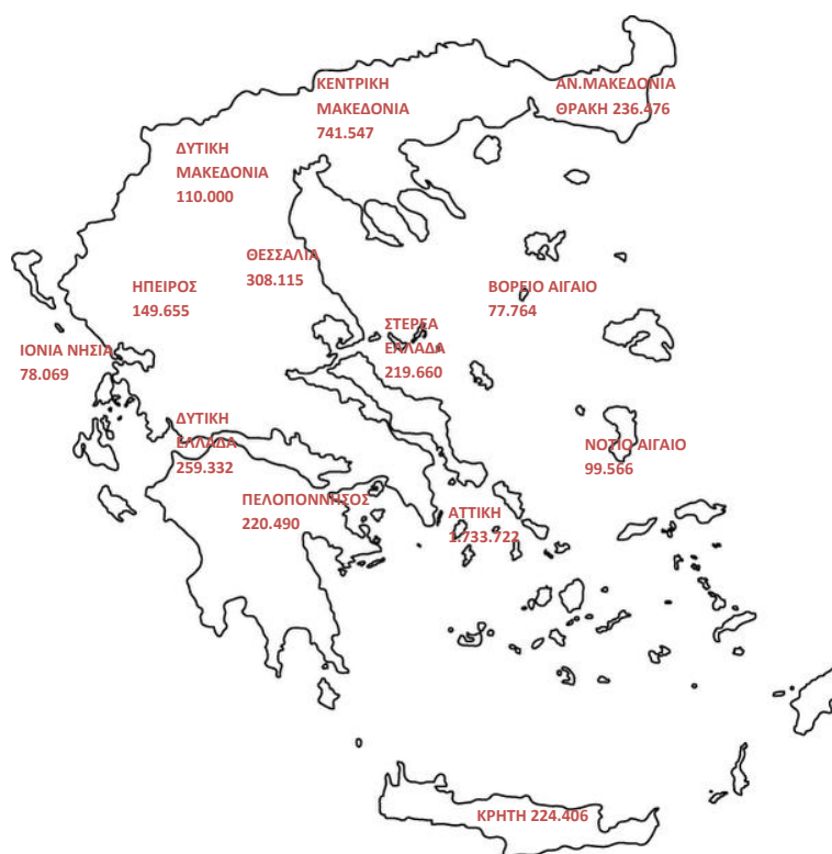
Χάρτης 1: Καταβολή Συντάξεων ανά Περιφέρεια

Στον Πίνακα 25 αποτυπώνονται τα ποσά σύνταξης που αντιστοιχούν σε κάθε Περιφέρεια σε σχέση με το αντίστοιχο ΑΕΠ για το έτος 2013 (προσωρινά στοιχεία ΕΛΣΤΑΤ). Σύμφωνα με τα δεδομένα του Πίνακα, στην Περιφέρεια Ηπείρου παρατηρείται η μεγαλύτερη τιμή (21,6%) του λόγου ποσού σύνταξης προς ΑΕΠ και ακολουθεί η Περιφέρεια Θεσσαλίας με τιμή 19,7%. Στην τελευταία θέση βρίσκεται η Περιφέρεια Νοτίου Αιγαίου με τιμή 10,2%.