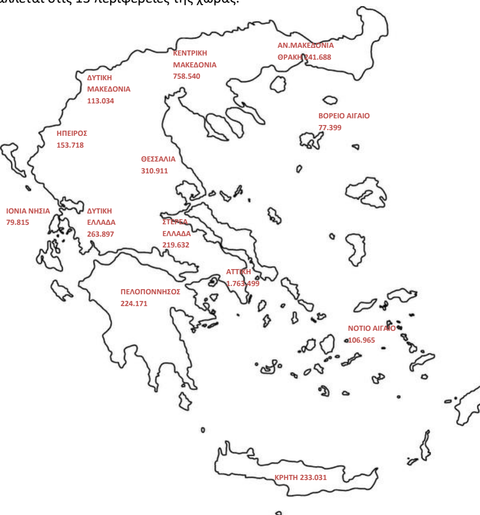
Χάρτης 1: Καταβολή Συντάξεων ανά Περιφέρεια

Για 27.234 εγγραφές δεν υπήρχε ένδειξη ΤΚ και για το λόγο αυτό δεν περιλαμβάνονται στον Πίνακα 7. Στο χάρτη που ακολουθεί αποτυπώνεται ο αριθμός των συντάξεων που καταβάλλεται στις 13 περιφέρειες της χώρας.